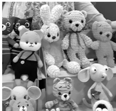
Куклы от объединения «Братина»