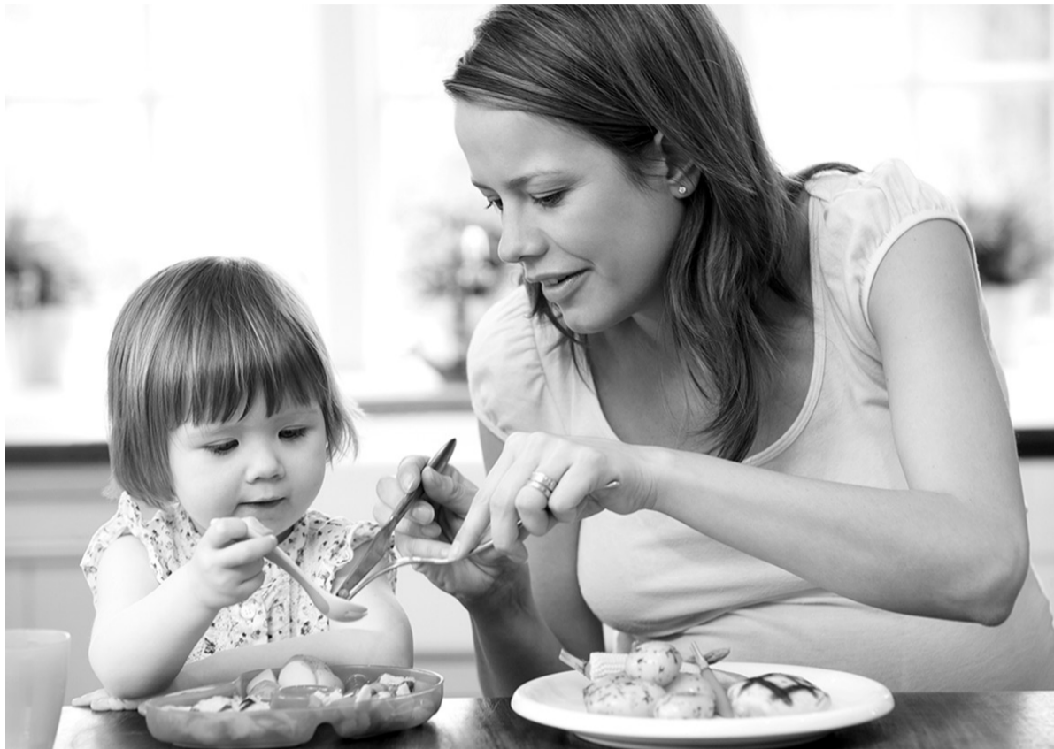
К правильному питанию нужно приучать с детства

Иногда термическая обработка идет овощам на пользу. Классический пример — томат, при нагреве увеличивается доступность биологически активного вещества ликопина (мощный антиоксидант). Или возьмем такие корнеплоды, как свекла или морковь. В сыром виде они тяжело перевариваются и дают серьезную нагрузку на ЖКТ. А после термической обработки, и лучше всего в пароварке, усвоить их будет легко, и все полезные вещества мы получим. Не любят температуру и быстро разрушают-