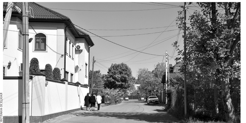
Улица Старикова ведет к улице Парковой

За всё войну он не был ни разу сбит или ранен, а погиб уже в мирном октябре 1945 года в авткатастрофе в Крыму, где и похоронен.