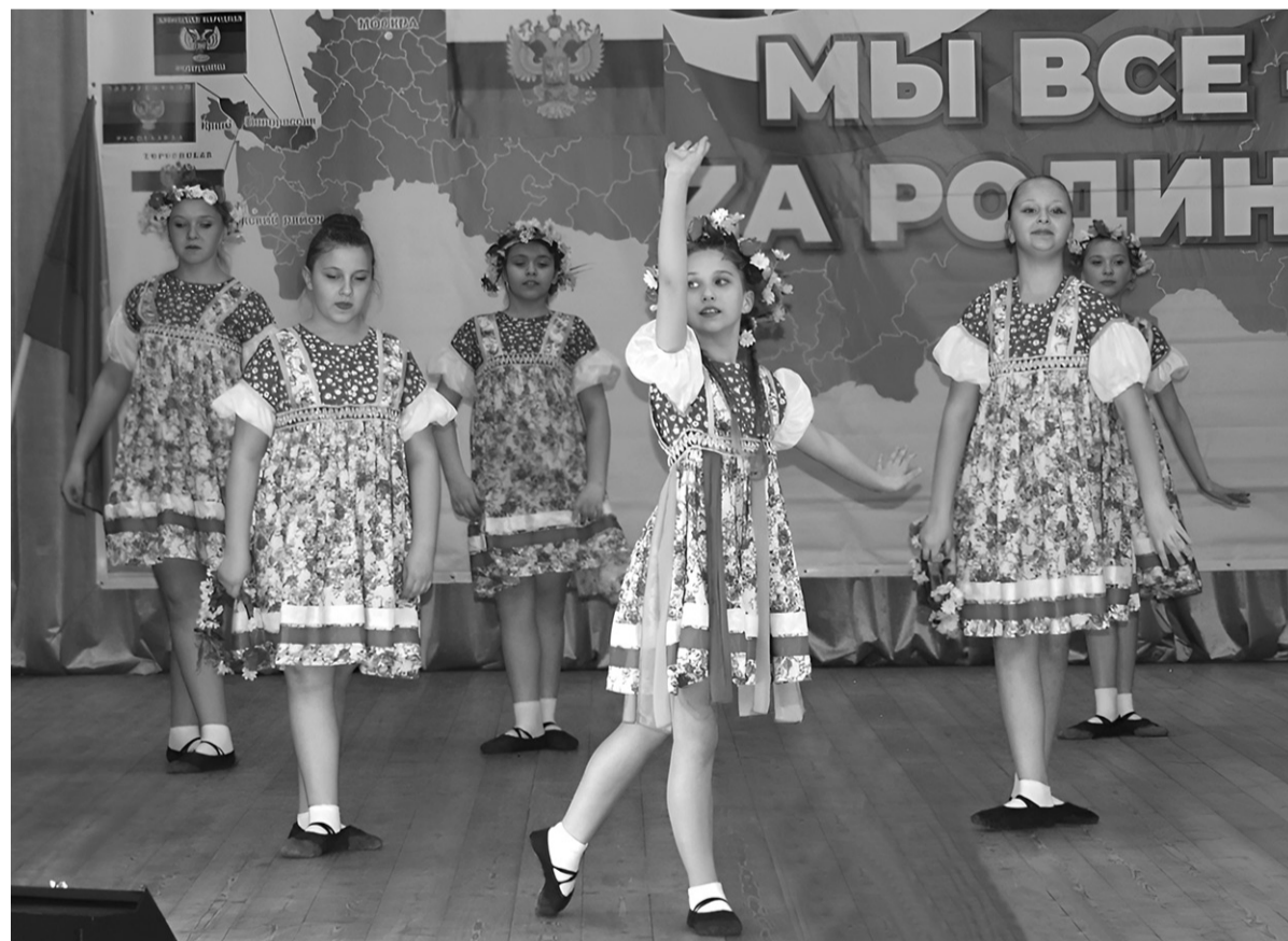
Фрагмент отчетного концерта отдела культуры администрации Зеленчукского района

Еще больше интересного и нового на сайте denresp.ru